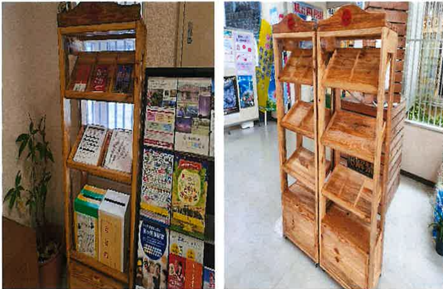
(事業1：パンフレットスタンド)