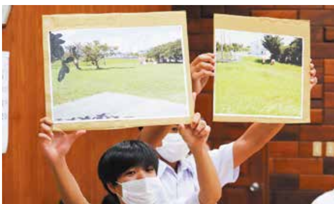
公園の状況を写真で説明（仲田公園、内花公園）