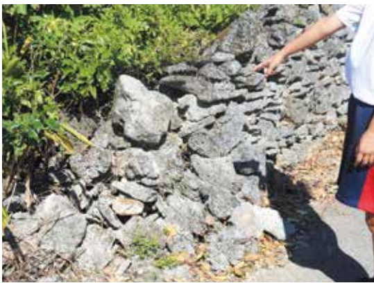
石垣が崩れている様子

私達は、いつかの空き家を見て回ったところ、草が伸びたり、石垣が崩れているのが気になりました。空き家をきれいにして、観光客が宿泊できるようにしたら、空き家を有効活用できるのではないかと考えました。そこで、島で古民家再生に取り組んでいる人に、取材をしたところ「島の風景を守るために古民家再生を行っている」との言葉を聞きました。そこで、私達は改めて島について考え、「写真では伝わらない島の暮らしの良さを実際に『来て、見て、感じる』ほじり」という答え