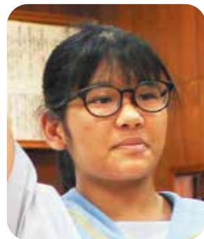
な 嘉 名 ひめ 愛 議員