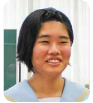
うえはら なつき 議員 上原 夏希 議員