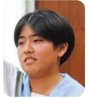
なかだ かりな 議員 仲田香里奈