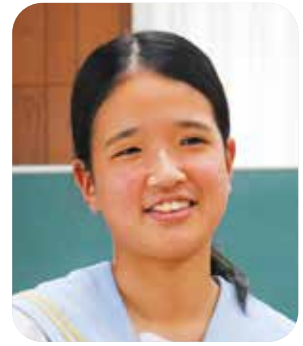
入江 姫良 議員