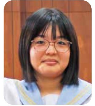
な 名 嘉 お 音 年 議員