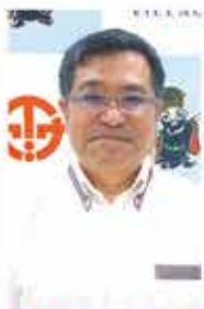
◆伊是名村固定資産 評価審査委員会委員