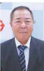
◆伊是名村教育委員会教育委員