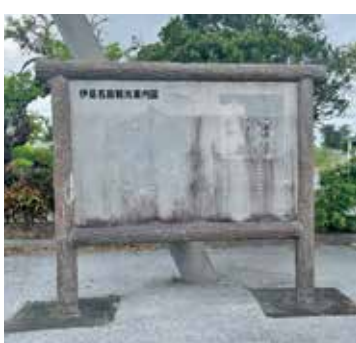
劣化がみられる観光案内板

マップなど、携帯で QR コードを読み込むことで、他の市町村にも劣らない素晴らしい情報が入っています。