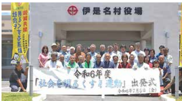
「社会を明るくする運動」伊是名村出発式