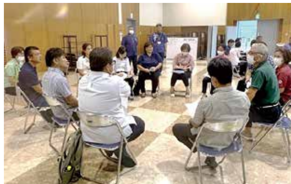
各テーマに沿って、グループ協議