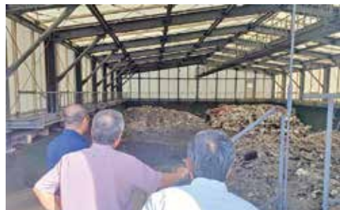
南大東村エコセンター (廃棄物処理最終施設最終処分場)