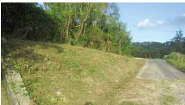
農道糸数原 6 号線