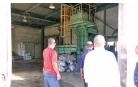
南大東村クリーンセンター (ゴミ焼却場)

ました。懇親会では、南大東村議員、全員が参加していただきました。初めての南大東村でしたが、本村の先輩方から、南大東村はおもてなしがすごいと聞いていました。まさに話の通りでした。おもてなしの精神に感銘を受けました。本村とシマンチュウ氣質が似ていると感じました。さとうきび畑はほとんど雑草が生えていなく、「雑草が生える前に草を絶つ」という格言は勉強になりました。廃棄物処理、ゴミ焼却場見学をさせてもらいましたが、ゴミが相当少なく、村民の意識が高いと感じました。村民所得が県内でも毎年