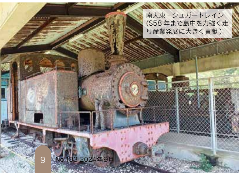
南大東 - シュガートレイン (S58年まで島中を力強く走り産業発展に大きく貢献)

て作られた南大東漁港、西側には定期船が接岸する西港、スケールの大きさと想像を絶する港湾事情を目の当たりにする。戦後は伊是名村からの移住者も多く今でもその子孫の方々が島の未来、発展のために頑張っている姿に感動を受けました。豊年祭等での神輿の奉納や江戸相撲、大東寿司など八丈島文化と沖繩文化を融合しながら特異な歴史や自然、文化、産業を持ちこれからも発展を目指す南大東村はまさに開拓スピリッツの島だと感じた今回の視察でした。