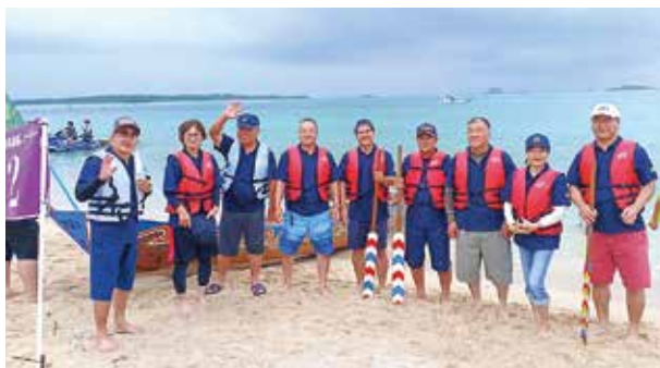
村議会議員のみんなでハーリー大会に参加