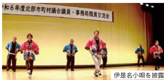
伊是名小唄を披露