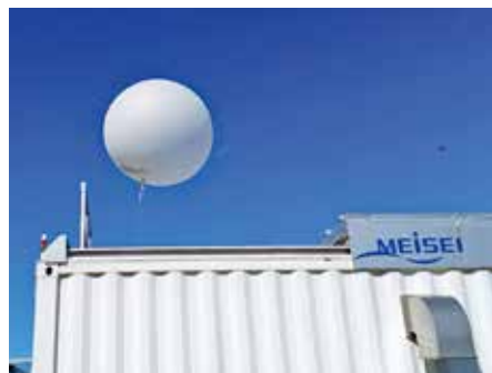
気象台（観測バルーン打上）

準で上位に位置することが納得できる。サトウキビ以外では、かぼちゃ、パイナップルの生産に力を入れており、輸送方法は船舶となっていた。次に漁業においては、断崖絶壁の課題を克服すべく、島をくりぬく画期的な工法で完成させた漁港整備が功を奏し、漁獲量は120・8トンを超えるそうです。その出荷の内訳は、島内30・3トン、島外90・5トン。島が断崖絶壁に囲まれ、しかも周囲が深海になっていることから、本村で収穫される魚類とは大きく異なることができました。