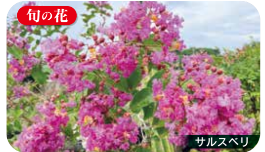
【花言葉】 雄弁・愛嬌・あなたを信じる