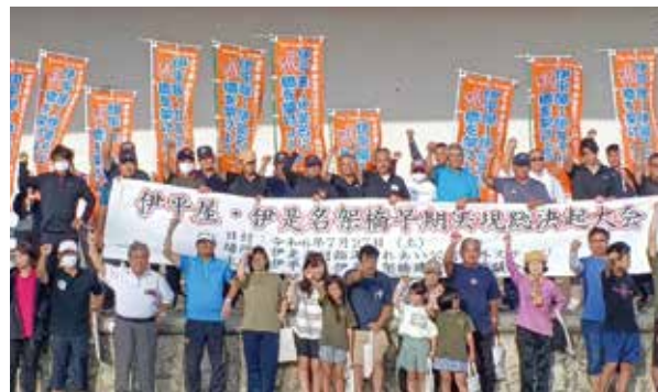
架橋の早期実現に向けた「ガンバロウ」