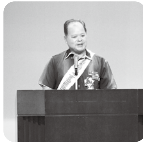
時期開催地(大宜味村長)