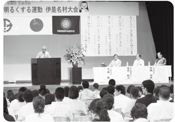
北部保護区保護司会(日高清文会長)