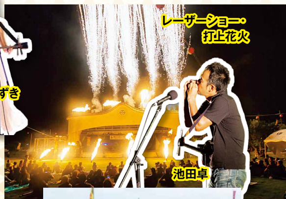
レーザーショー 打上花火