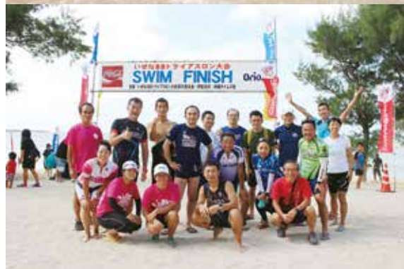
ボランティアした選手の皆さん