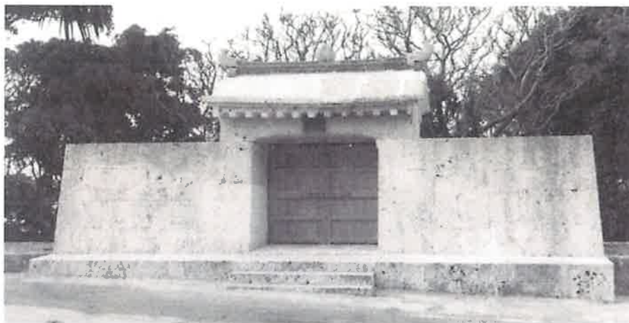
園比屋武御嶽石門（1980年復元時）

奥には約二メートル四方の祠があり、中には香炉が計24個（大型一個、小型二十三個）確認される。昔は、神女の山グマイが行われ、山籠りをする聖地とされた。加えて、子宝に恵まれない婦人の祈願所でもある。