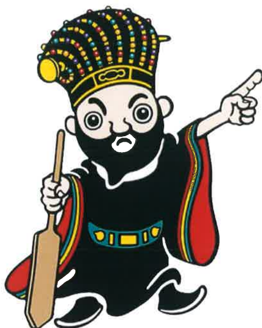
伊是名村イメージキャラクター 尚円王